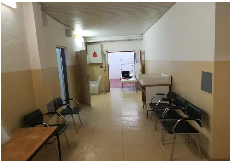
* Původní stav