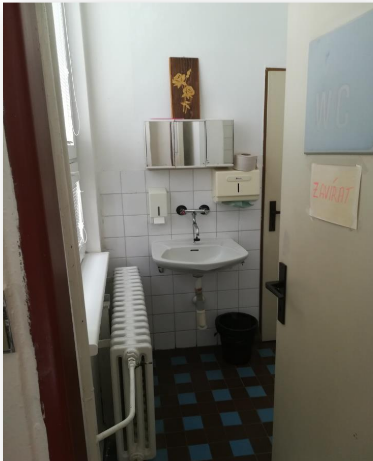
* Původní stav