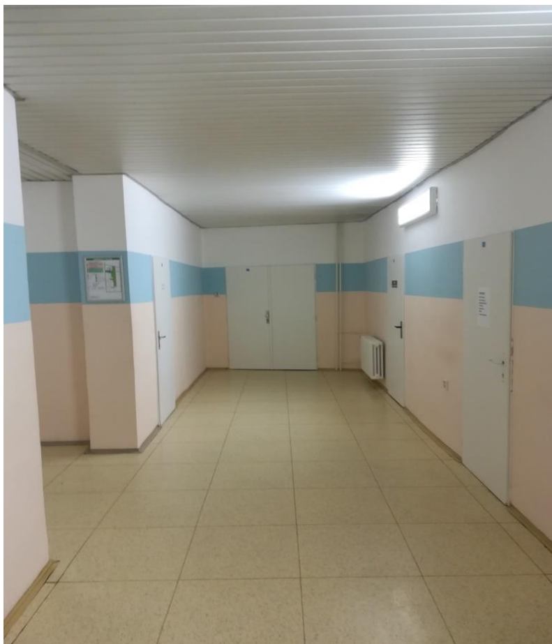
* Původní stav